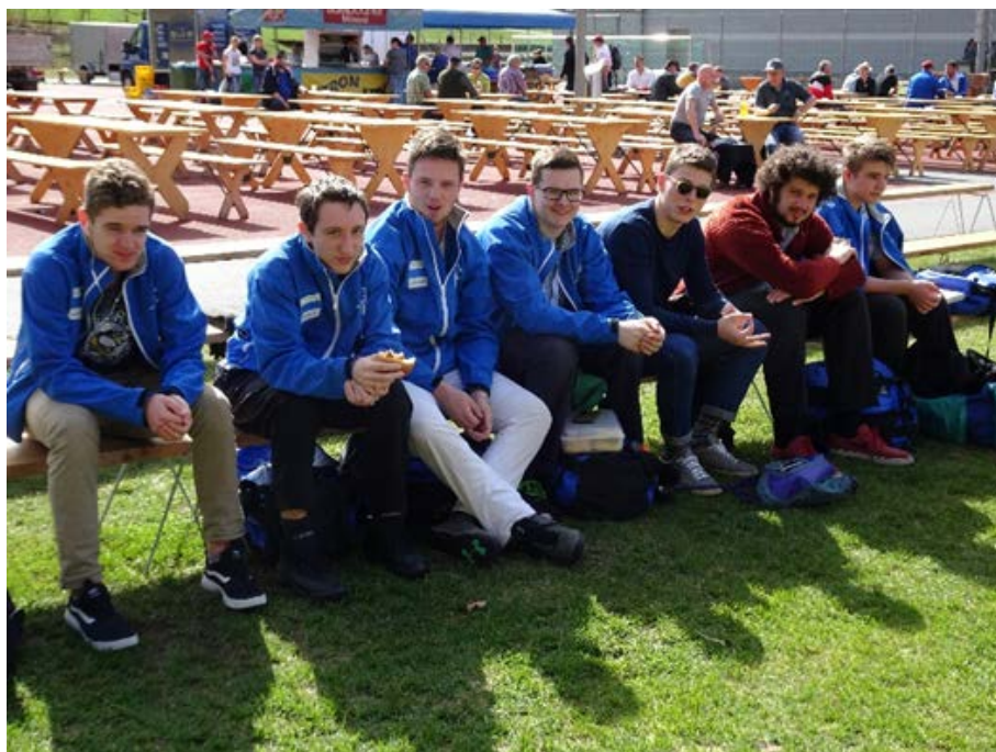
Muotathaler – Rangschwinget 8 aprile 2018

Quindi il mercoledì sera ci si allenava assieme dalle 18.00 alle 20.00.